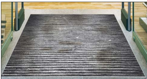
Vor der Reinigung