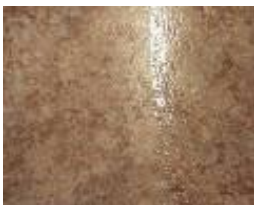
PVC / Linoleum